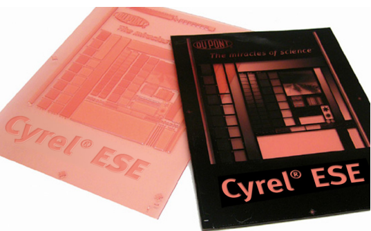
DuPont™ Cyrel® EASY ESE

La plaque numérique à surface microstructurée qui génère des points plats